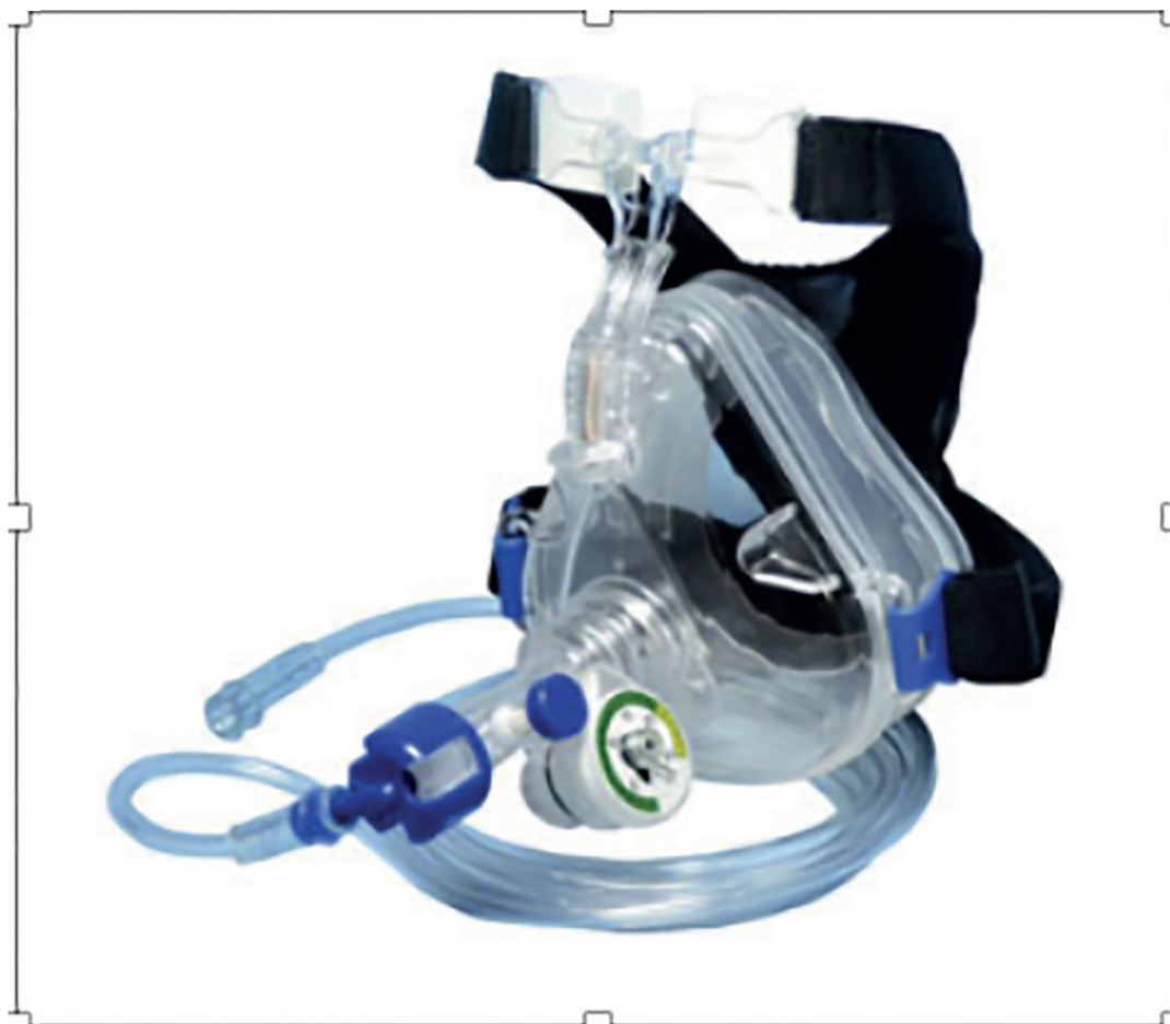
Рис. 1. Одноразовая система с постоянным положительным давлением Flow-Safe II (FSD-CPAPII-S; MercuryMed, штат Флорида, США).

Все анализы проводили в программе IBM SPSS Statistics 25.0. Для проверки нормальности числовых переменных использовали критерий Колмогорова-Смирнова ( n \geq 50 ). Числовые переменные представляли в виде среднего и стандартного отклонения или в виде